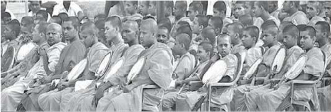
"අටු වනන් මිග නොවැළැක්වීමෙන් මේ පනවදිය මින් පවත් ඉදු මට වඩා නොවේ. එය අර මට වූ මිහි පුදුන්ක මේ ඉදු මින් අතර පුදු වේ."